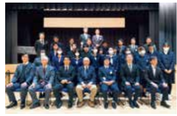
発表を終えた高校生との記念撮影