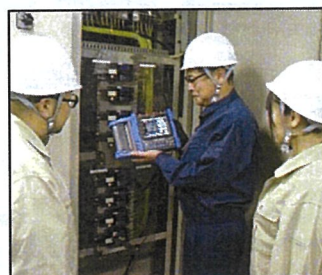
▲ 電気設備のトラブル対策実習

(4) 主な訓練分野 【機械系】 機械設計/加工、溶接加工 など 【電気・電子系】 電気設備保全、電子回路設計 など 【居住系】 建築設計・製図、建築施工、建築設備工事 など