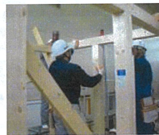
▲ 木造軸組加工法による建物組立の実習

「ハロートレーニングー急がば学べー」とは、新たなスキルアップにチャレンジするすべてのみなさんをサポートする公的職業訓練の愛称とキャッチフレーズです。