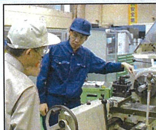
▲ 難削材の切削加工実習

地域のニーズを踏まえて訓練コースを設定し実施するほか、個別企業等のオーダーに応じた訓練も実施しており、IoTやAIといったデジタル技術を習得するための訓練コースも実施しています。